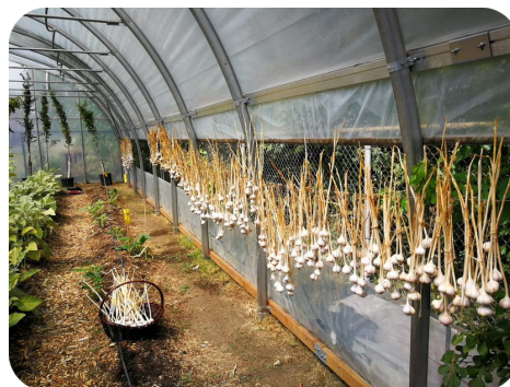
Serre des Jardins des Patriotes à l'école Louis-Joseph Papineau

Ce partenariat innovant École-communauté constitue l'une des forces de cette serre, à la fois éducative et productive.