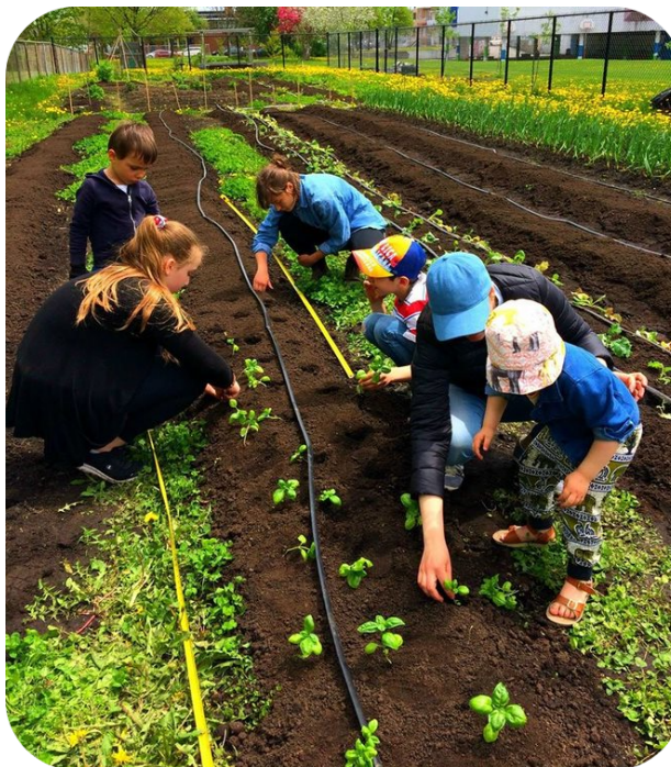
Enfants participants aux activités données aux Jardins des Patriotes-été 2019