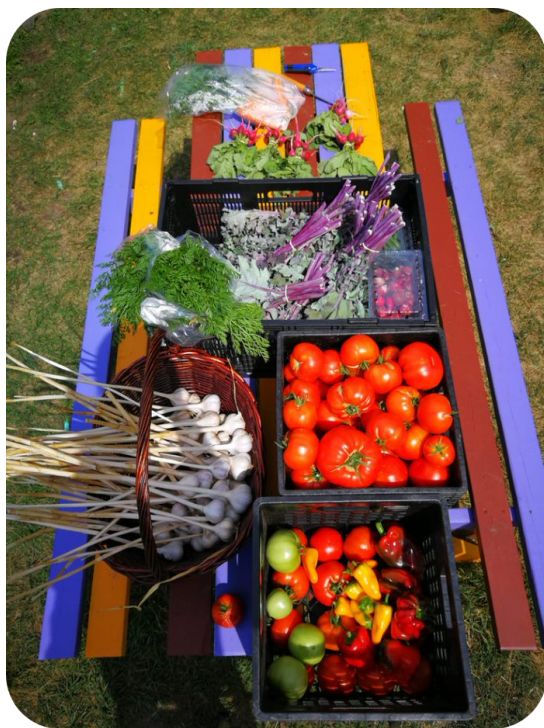
Récoltes des Jardins des Patriotes-été 2020

https://www.realisonsmtl.ca/budgetparticipatifmtl